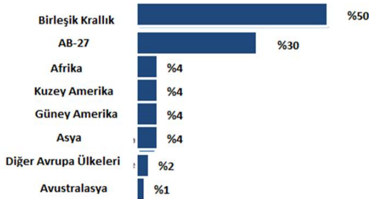
Şekil 2: Birleşik Krallık'ta Tüketilen Gıdaların Menşei 6

Tarım ve gıda ürünleri AB27 ile Birleşik Krallık arasındaki ticaretin %11'ini oluşturuyor. AB27 lehine olan ticaret dengesi verilerine göre 27 AB üyesi toplamda 47 milyar dolarlık ihracata karşın 18 milyar dolarlık ithalat yapıyor. 4 Birleşik Krallık, gıda talebinin %30'unu AB ülkelerinden karşılıyor; ancak bu oran gıda kalemlerine göre değişebiliyor. Örneğin Birleşik Krallık'ın meyve ithalatının %41'i AB'den gerçekleşirken; bu oran sebzelerde %76'yı buluyor. 5 Brexit'in en önemli sonuçlarından birisinin ticaret sapması olacağını vurgulayan analizler, bu anlamda hangi üçüncü ülkelerin hangi kalemlerde ön plana çıkabileceği konusuna odaklanıyor. Ancak bu konudaki belirsizliklerin ve değişenlerin fazla olması sebebiyle Birleşik Krallık'ın üçüncü ülkelerle geliştireceği yeni ticari ilişkiler konusunda oldukça sınırlı sayıda çalışma ve projeksiyon mevcut. Öte yandan senaryolar ve modellemeler çeşitlilik gösterse de tüm çalışmalar, Brexit'te Birleşik Krallık'ın AB27'ye kıyasla daha fazla kayıplar yaşayacağı konusunda hemfikir.