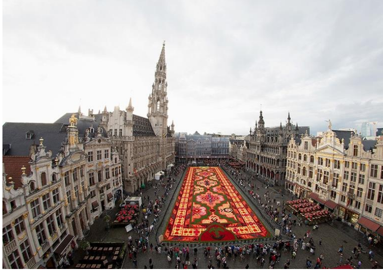
Belçika'ya Türk işçi göçünün 50'nci yılı etkinlikleri kapsamında Brüksel'in Grand Place meydanındaki dev Türk halısı